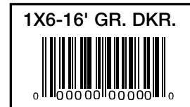
(A) Etiqueta en el extremo

Para facilitar la instalación, se recomienda utilizar tornillos de 6.4 cm (2-1/2") para cubiertas de madera de material compuesto resistentes a la corrosión. Estos tornillos ayudan a minimizar el efecto común denominado "hongo" que a veces se produce al utilizar sujetadores estándar. También pueden reducir la cantidad de perforación previa y el avellanado. Si se utilizan tornillos normales para terraza de hilo de rosca gruesa, recuerde siempre realizar previamente un agujero de prueba y avellanar antes de atornillar.